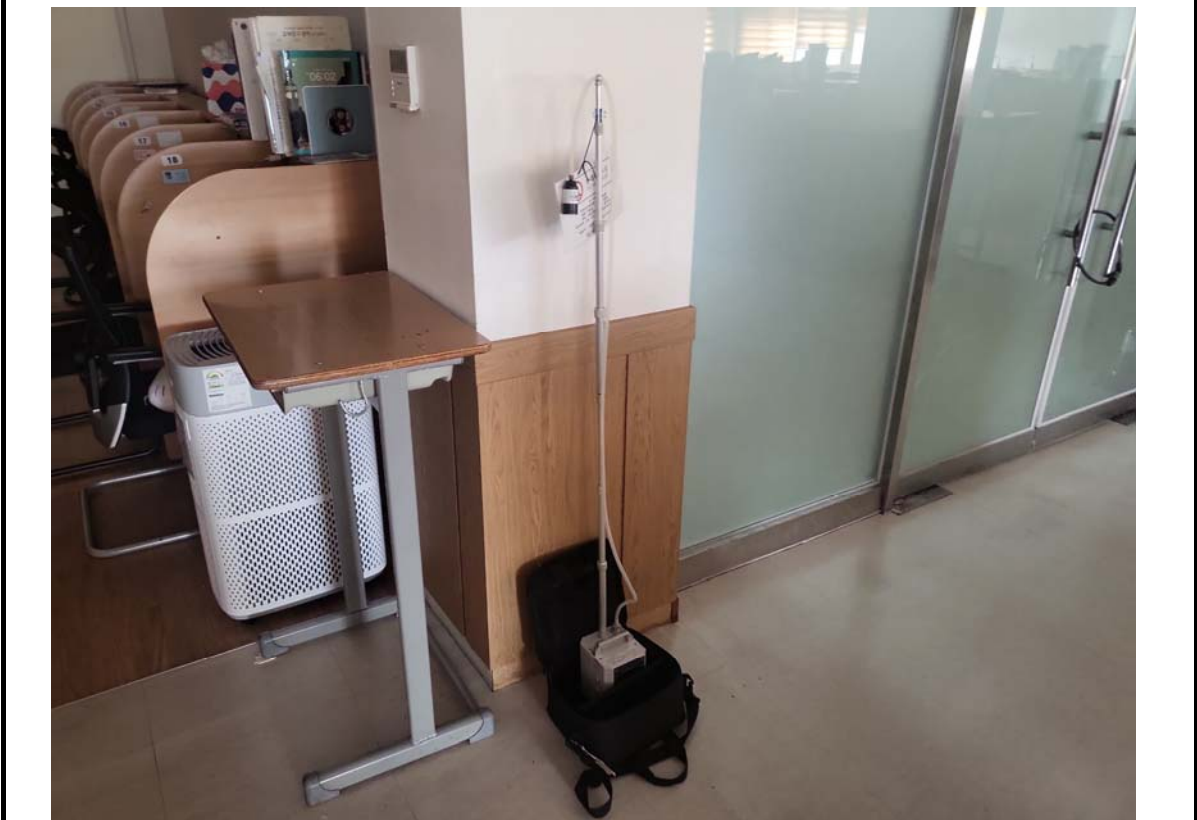
2022.09.30. 여고 5층 자기주도학습실