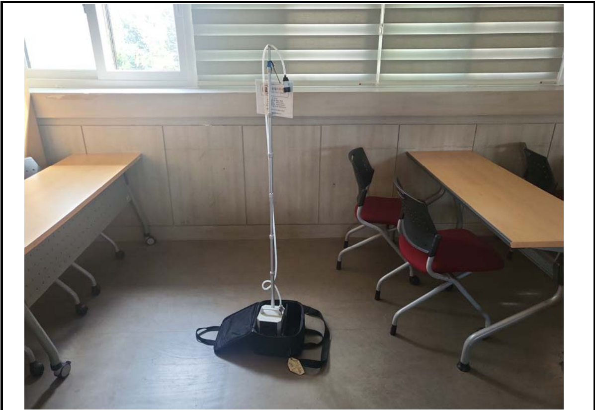
2022.09.30. 남고 3층 자기주도학습실5