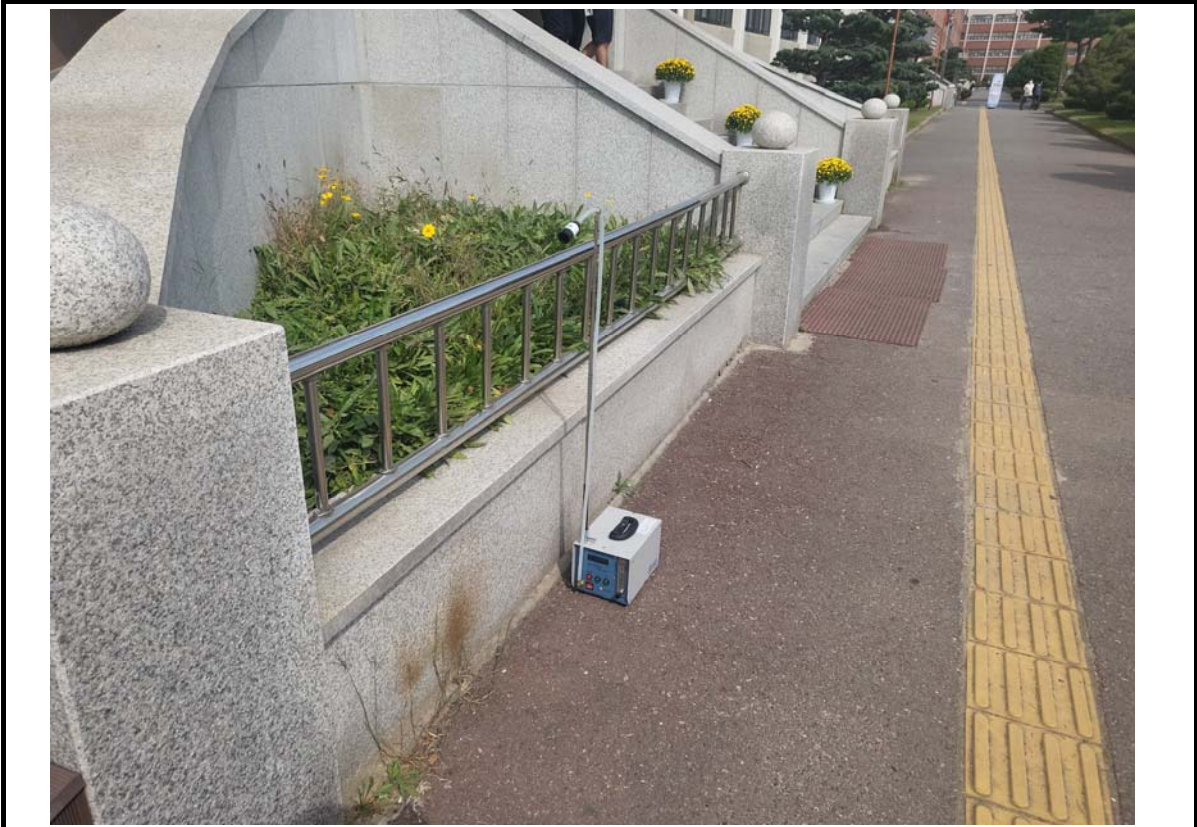
2022.09.30. 남고 중앙현관 화단